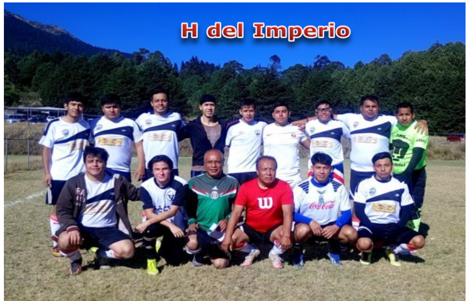
H del Imperio

Para que los Equipos puedan solicitar un Default, el equipo debe de estar uniformado, dentro de la cancha y haber entregado Hoja de Alineación y Registros durante la Tolerancia.