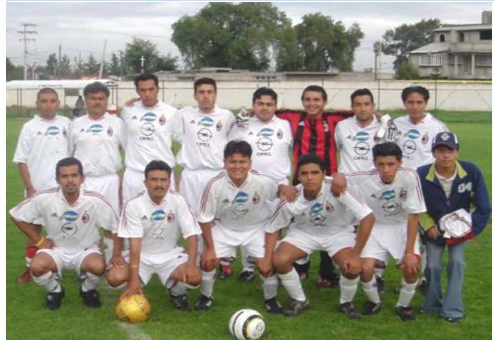
Equipo MILAN en Baeza, Texcoco el 24 de Julio de 2005

LOS EQUIPOS TIENEN LA OBLIGACION DE REGISTRAR UN MINIMO DE 2 CUERPO TECNICOS Y PODRAN REGISTRAR UN MAXIMO DE 5.