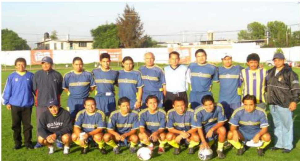
DEPORTIVO GUADALUPE 2005

Si un partido se suspende por causa de la lluvia los criterios a seguir serán los siguientes: