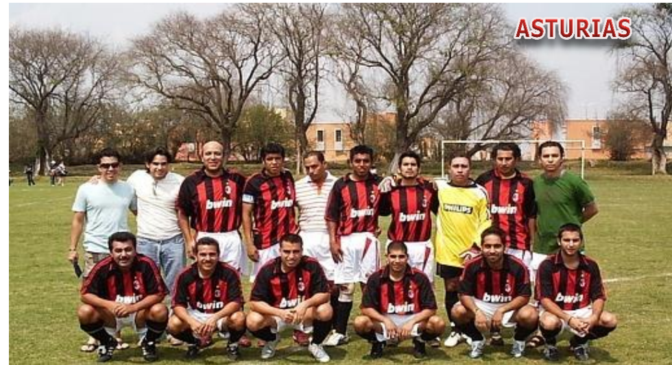
CD LA FAMA