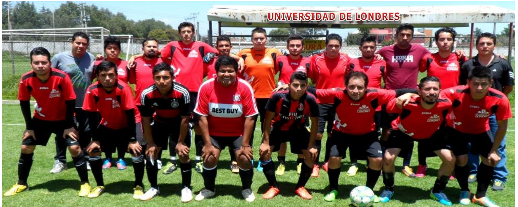
UNIVERSIDAD DE LONDRES