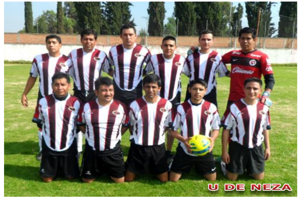
U DE NEZA