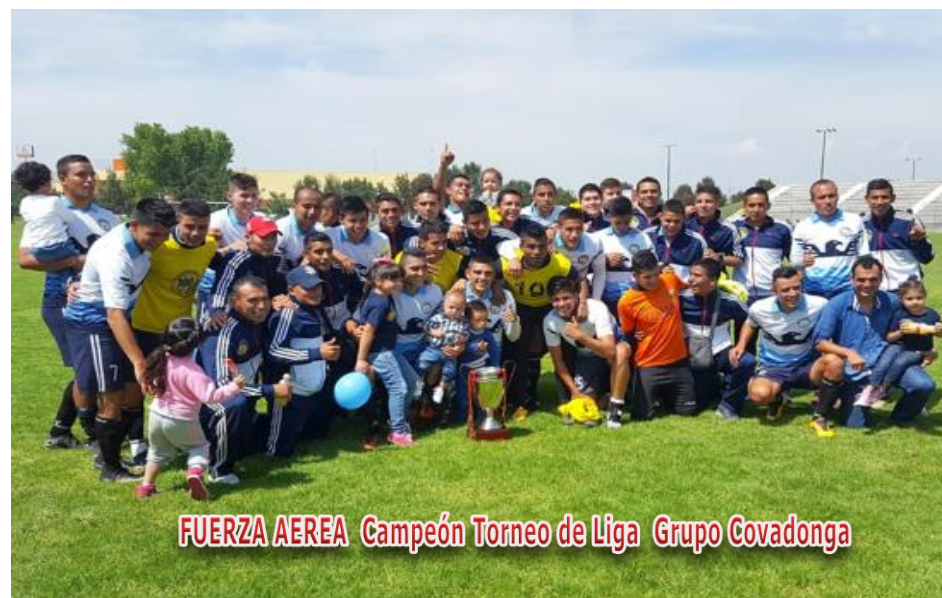
FUERZA AEREA Campeón Torneo de Liga Grupo Covadonga