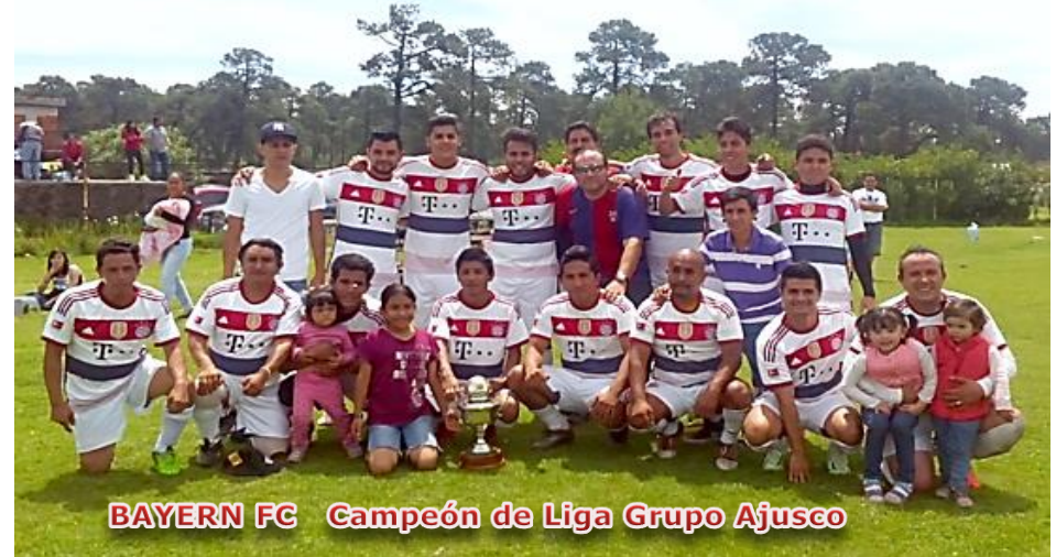
BAYERN FC Campeón de Liga Grupo Ajusco

Visite la página de Internet de la Liga: www.ligaes.com