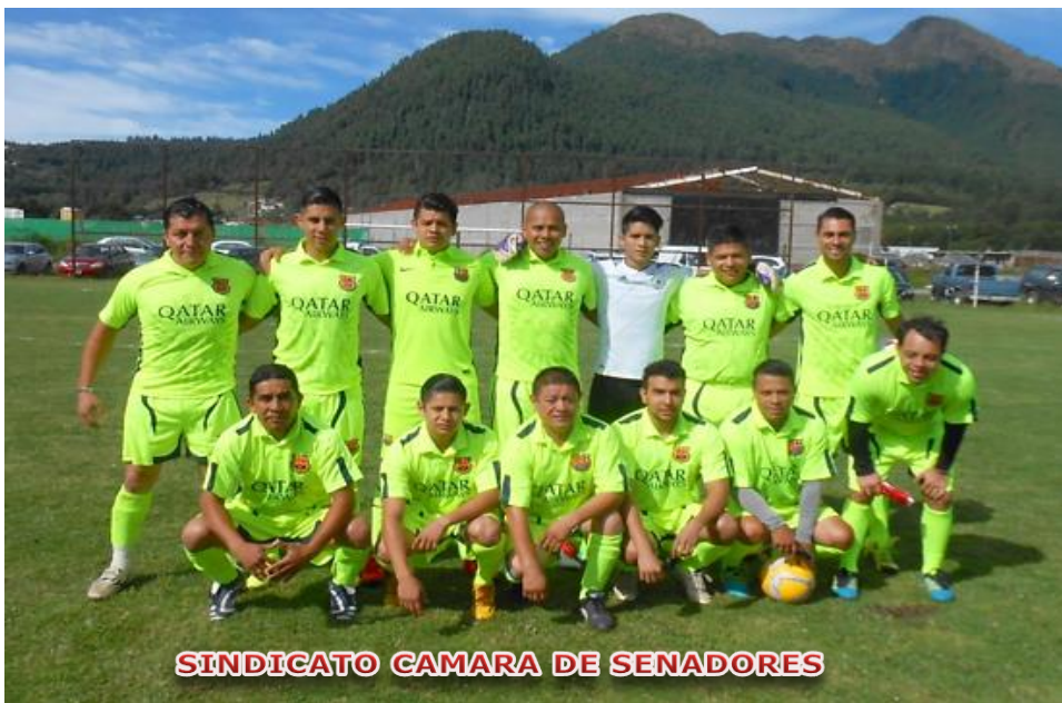
SINDICATO CAMARA DE SENADORES