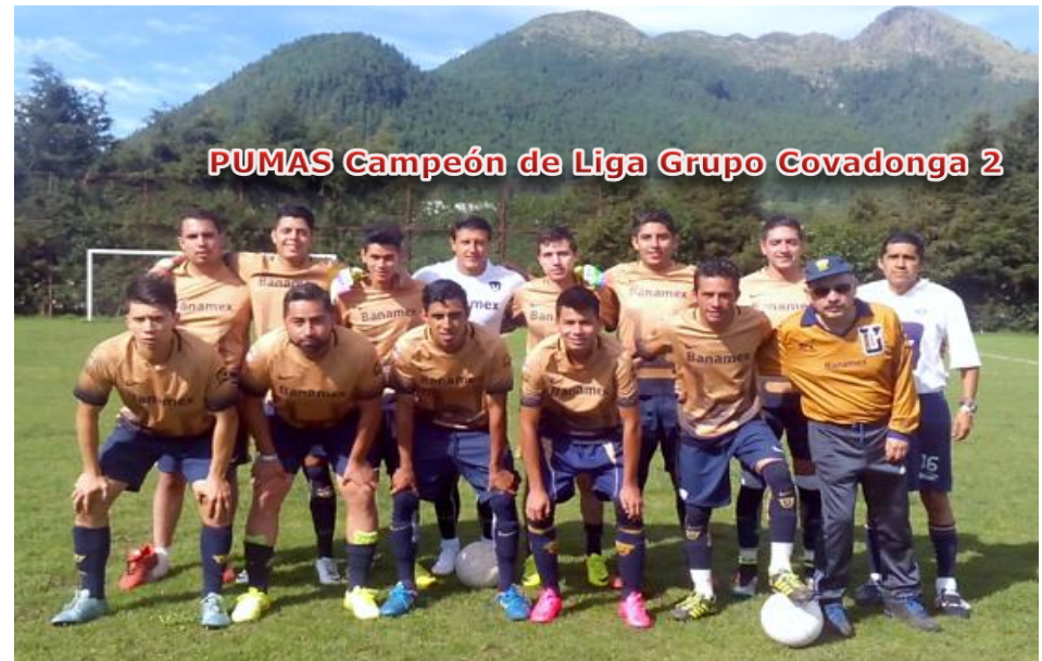
PUMAS Campeón de Liga Grupo Covadonga 2