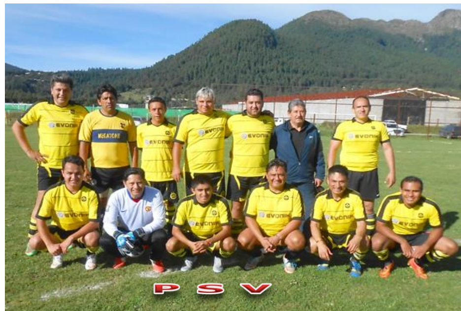
P S V