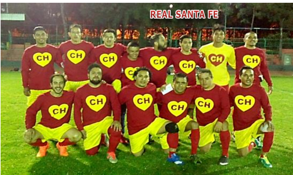
REAL SANTA FE

Visite la página de Internet de la Liga www.ligaes.com