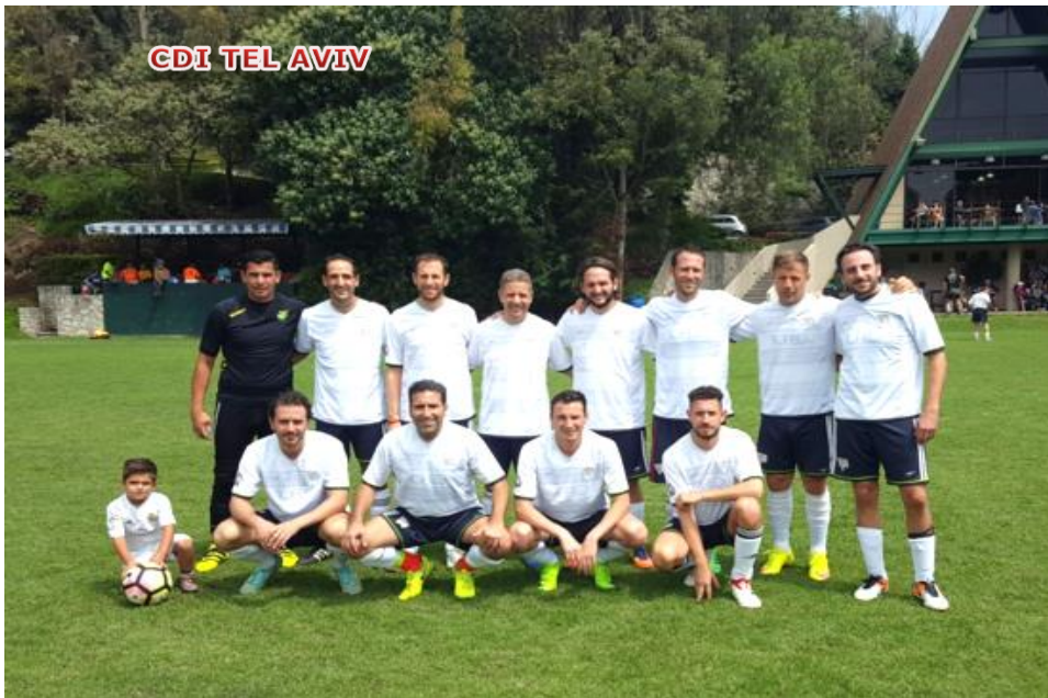
CDI TEL AVIV