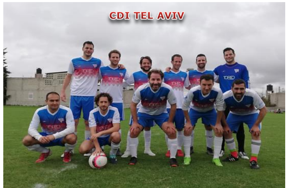
CDI TEL AVIV