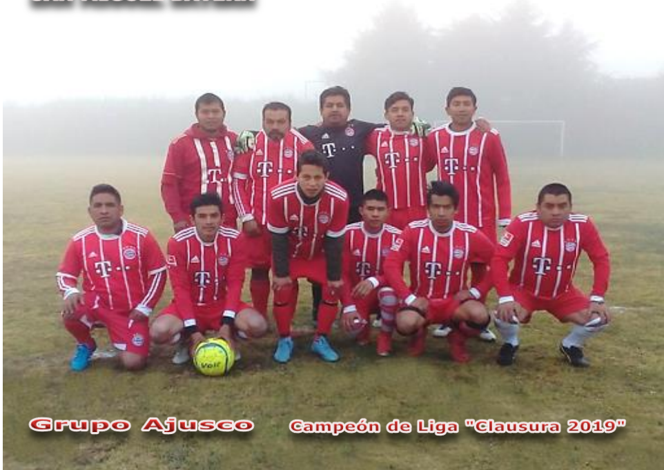
Grupo Ajuseo Campeón de Liga "Clausura 2019"

Obligación de presentar 2 Balones en condiciones reglamentarias