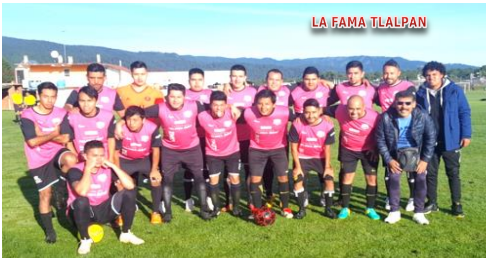
LA FAMA TLALPAN