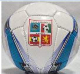
Con 3 capas $250