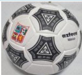
Con 3 capas $250