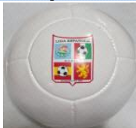
Con 2 capas $160