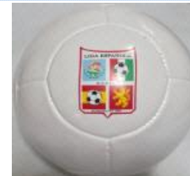
Con 2 capas $160

Visite la página de Internet de la Liga: www.ligaes.com