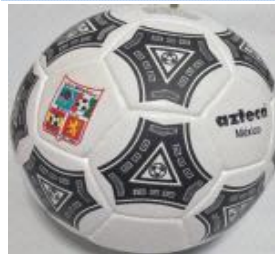
Con 3 capas $250