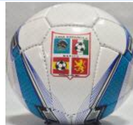
Con 3 capas $250