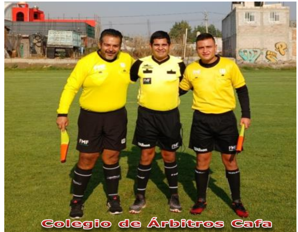
Colegio de Árbitros Cafa

Lean las Notas publicadas en los Boletines