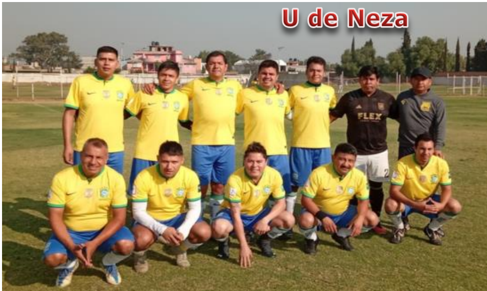
U de Neza

Los Equipos deberán de estar inscritos y contar con los Registros de 2024 Torneo de Liga Apertura 2024 inició el 28 de Enero, finaliza en Junio. El Formato de Inscripción para Equipos y para Jugadores está en la página de la Liga: www.ligaes.com en Inscripciones. También pueden solicitarlos en las oficinas de la Liga.