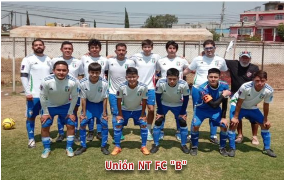
Unión NT FC "B"