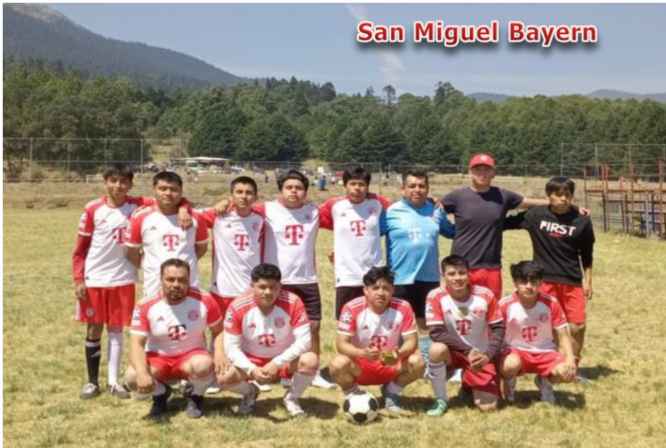
San Miguel Bayern

Obligación de presentar 2 Balones en condiciones reglamentarias