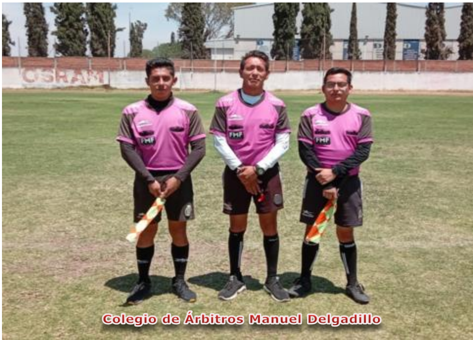
Obligación de presentar la Hoja de Alineación actualizada