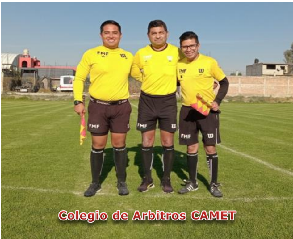
Colegio de Arbitros CAMET